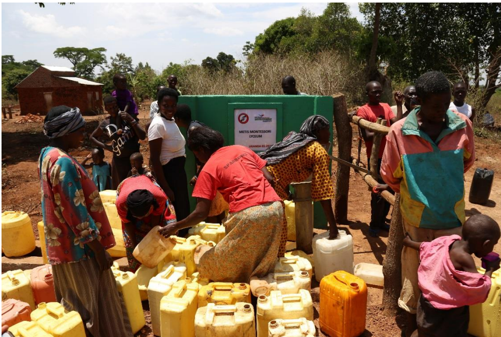
Inwoners bij de waterput 'Metis Montessori Lyceum' in Iganga te Oeganda, februari 2017.