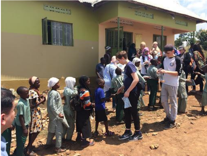
Leerlingen van het Metis Montessori Lyceum delen schoolspullen en cadeautjes uit aan kinderen van een weeshuis in Oeganda.