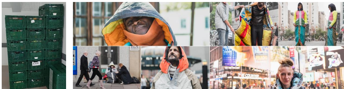
Foto links: onze 22 gevulde kratten voor de Voedselbank. Rechts: de pakken van Sheltersuit

Wie nog een slaapzak wil doneren: in de centrale hal, tegenover de receptie, staat een rolkar waar je je slaapzak in kunt doen. Dat kan tot en met vrijdag 13 januari. Dank allemaal voor jullie bijdrage!