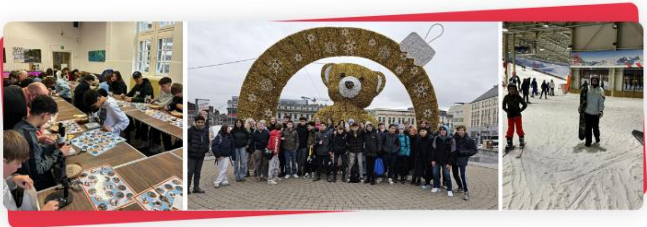
Binnen en buiten leren leerjaar 2