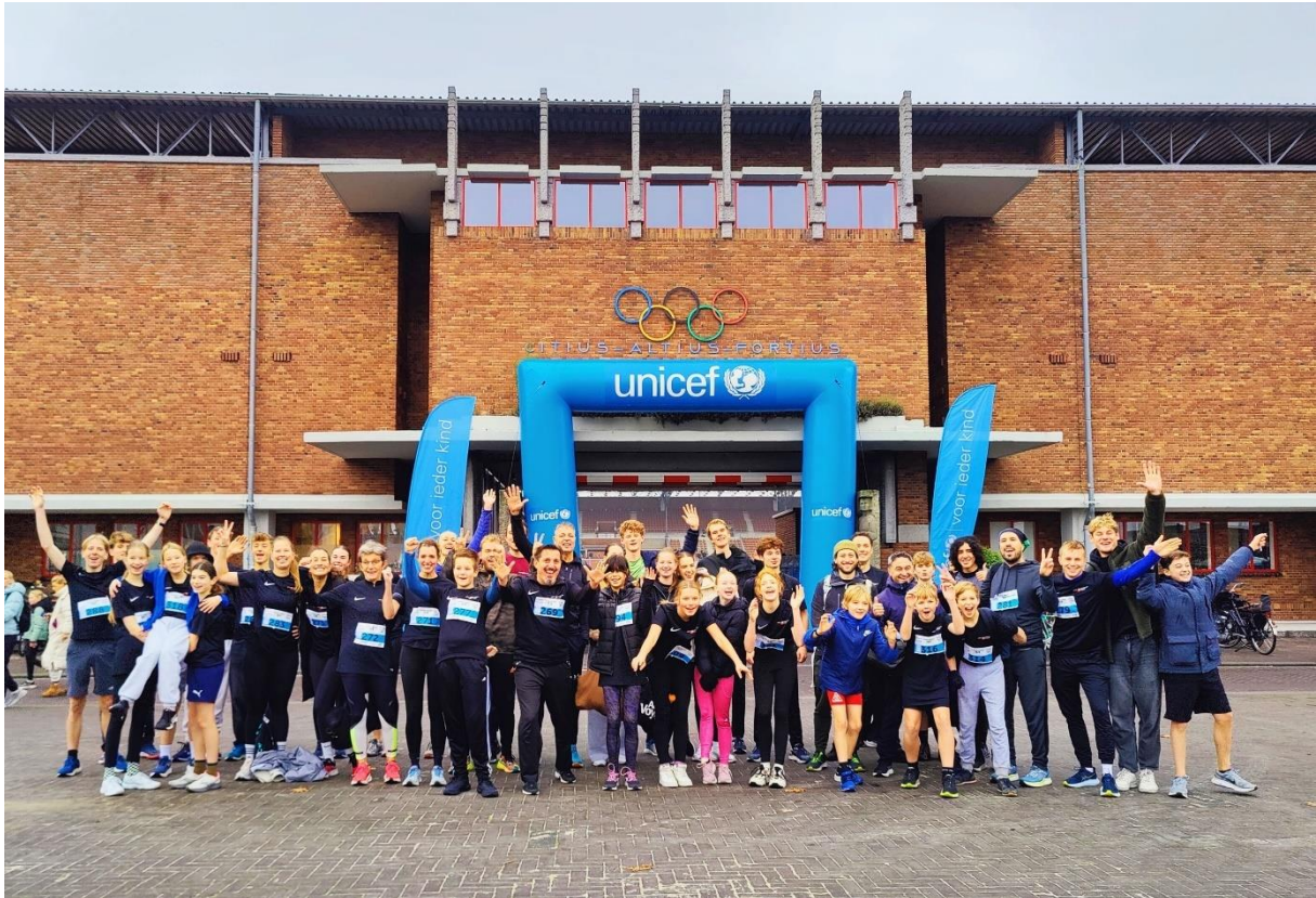
Olympisch Stadionloop samen met leerlingen