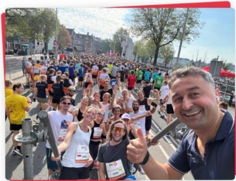
Van Dam tot Damloop

Er voor alle scholieren in Amsterdam sportieve activiteiten te doen zijn? Klik een paar keer door op deze link naar het sportaanbod in de gemeente Amsterdam . Het hele jaar door kun je sporten, maar in de vakanties is er een speciale sportkalender , met komende kerstvakantieweken leuke winteractiviteiten en sportfestijnen in de stadsdelen.